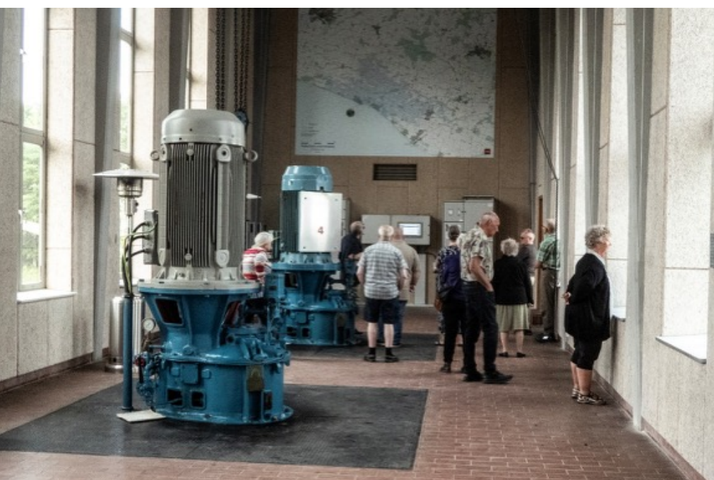
Kramnitse pumpestation der sørger for at holde det sydlige Lolland tør. Stationen har en kapacitet på 20 m 3 i sekundet.